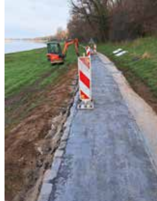
letzte Arbeiten an Böschung und Bankett

für die Absenkung auf diesem Abschnitt konnte die Verwendung von ungeeignetem,