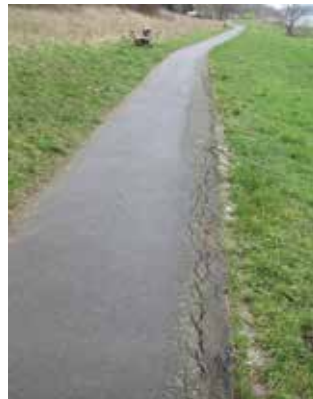
Abgängiger Randstreifen vor Baubeginn

vor Baubeginn) Noch im vergangenen Jahr erfolgte eine beschränkte Ausschreibung zu den Instandsetzungsarbeiten, der Auftrag wurde an die Firma Gunter Nitsche Straßenbau aus Großenhain auf das wirtschaftlichste Angebot erteilt. Aufgrund von ungünstigen Witterungseinflüssen und Problemen beim Materialbezug (Asphalt) konnte die Maßnahme zum Ende des letzten Jahres hin nicht mehr realisiert werden. Die Reparaturarbeiten wurden nunmehr im März begonnen und relativ zügig umgesetzt. Als Ursache