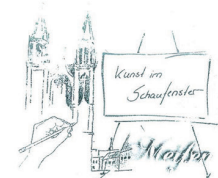
Klotzsche, Dieter Ölmalerei

Besichtigung: Di, Do, Sa, So und feiertags 10 - 17 Uhr Mi, Fr 10 - 14 Uhr, montags geschlossen