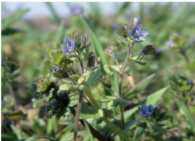
Abb. ND und Flora 37